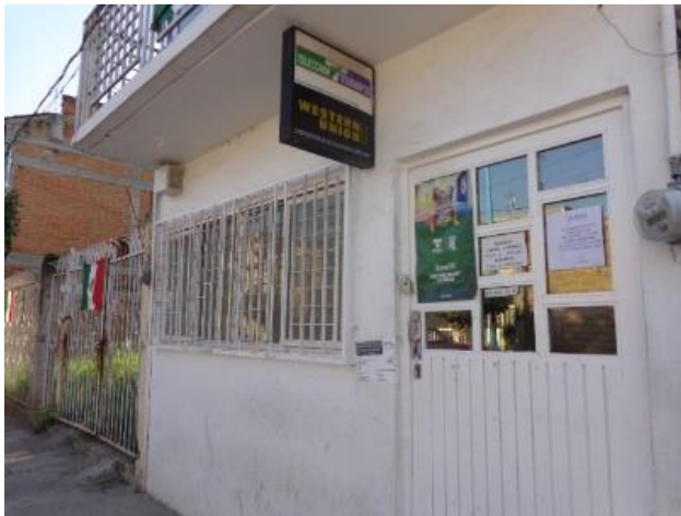
Distribución de folletos sobre el tema de la credencialización desde el extranjero. Telecomm, San Francisco del Rincón, 18 de septiembre de 2017.