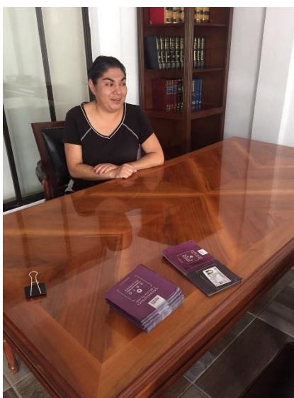
Distribución de folletos sobre el tema de la credencialización desde el extranjero. Agencia de viajes "Los mismos", León, 21 de septiembre de 2017.