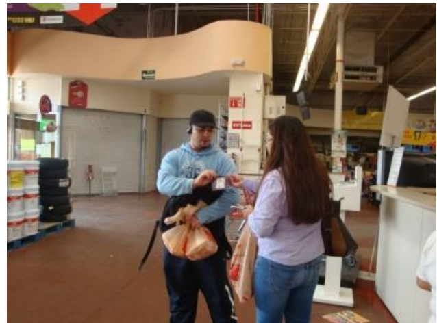
Distribución de folletos sobre el tema de la credencialización desde el extranjero. Soriana, Acámbaro, 20 de septiembre de 2017.