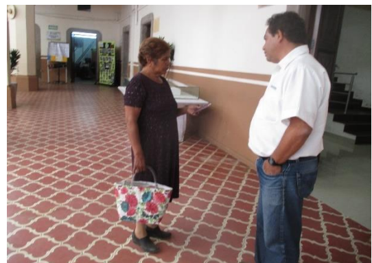
Información sobre el tema de la credencialización desde el extranjero y entrega de folletos. Presidencia municipal, Santa Cruz de Juventino Rosas, 18 de septiembre de 2017.