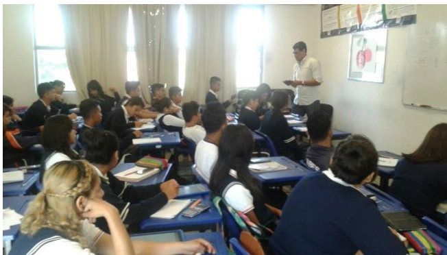
Plática de sensibilización de la campaña “Credencialízate y activa tu INE desde el extranjero”. SABES San Cristóbal, Irapuato, 25 de agosto de 2017.